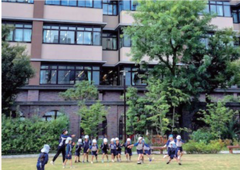
学校法人渋谷教育学園 阪本こども園