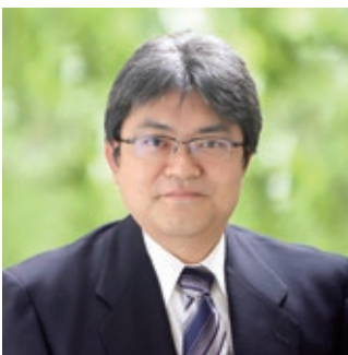
学校法人渋谷教育学園 阪本こども園 統括園長

令和3年4月、中央区で初めて公募された公私連携幼保連携型認定こども園を開設することとなりました。新しくスタートする阪本こども園は、前身の阪本幼稚園の伝統を継承しつつ、これからの新しい社会に相応しいものとして準備を進めてきました。「就学前の子どもに関する教育・保育等の総合的な提供の推進に関する法律」に基づく、幼稚園機能と保育園機能を一体化した新しい制度の総合施設となります。明るい環境、近代的な素晴らしい施設の中で、子ども達の自主性を重視した自発的な活動や好奇心に基づく自由なところを育むことを教育・保育の目的としています。地域の皆様に愛される園を目指し一生懸命取り組んでいきますので、渋谷教育学園の阪本こども園をこれから宜しくお願い致します。