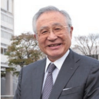
学校法人渋谷教育学園 理事長