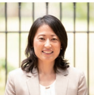
学校法人渋谷教育学園 阪本こども園 園長